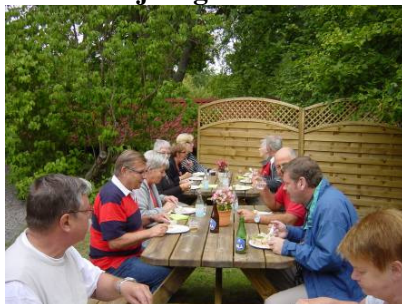
Foto familjedag 090815