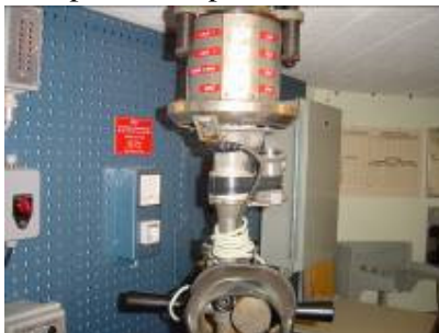
Bild på instrumentering & periskop