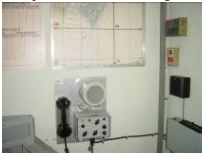
Bild på mininstrumentering M4