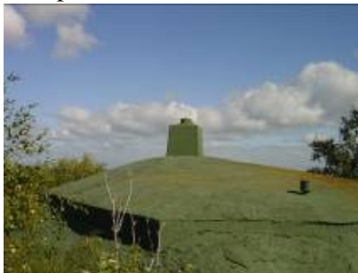
Bild på ingång till anläggningen