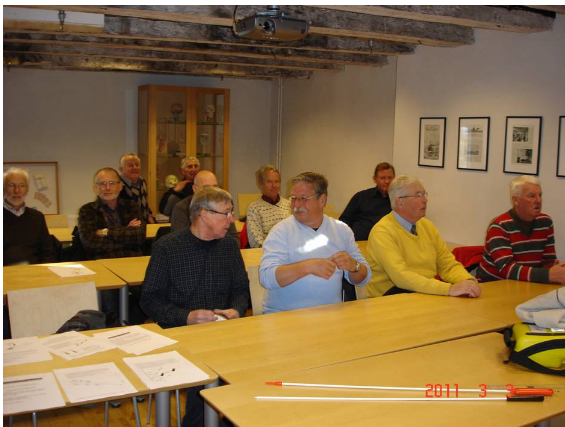
Intresserade Hjärt-Lung-Räddare samlade i "Finska Kyrkan" på Marinbasen