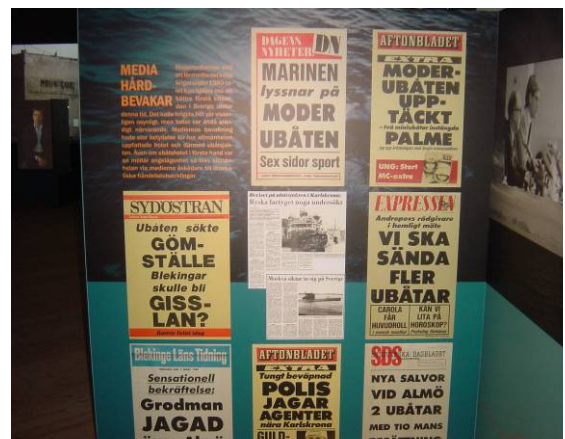
Div. löpsedlar från den tid då vi alla mer eller mindre var inblandade i olika ubåtsskyddsoperationer.