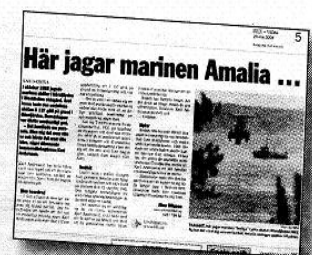
BLT den 20 maj.

✓ Den 13 oktober klockan 01.06 (cirka två timmar senare) häver Försvarsstabens eldförbu-